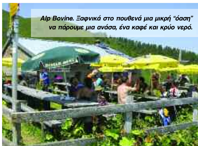
Alpi Bovine. Ξαφνικά στο πουθενά μια μικρή "όαση" να πάρουμε μια ανάσα, ένα καφέ και κρύο νερό.