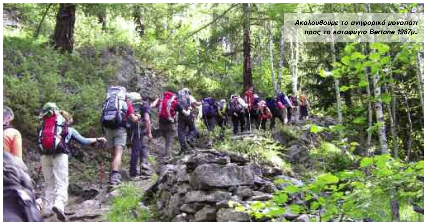
Ακολουθούμε το ανηφορικό μονοπάτι προς το καταφύγιο Bertone 1987μ..