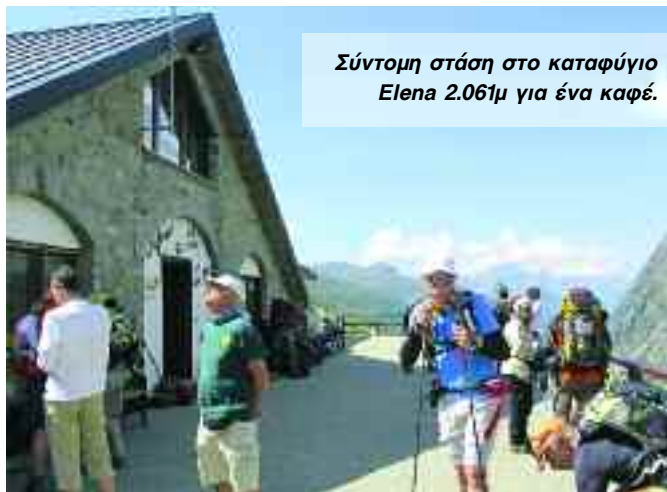
Σύντομη στάση στο καταφύγιο Elena 2.061μ για ένα καφέ.