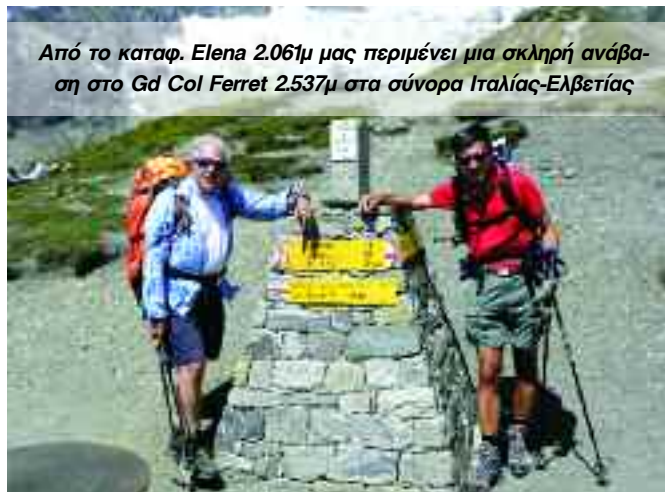
Από το καταφ. Elena 2.061μ μας περιμένει μια σκληρή ανάβαση στο Gd Col Ferret 2.537μ στα σύνορα Ιταλίας-Ελβετίας