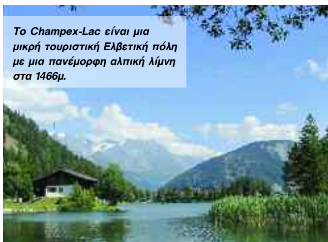
Το Champex-Lac είναι μια μικρή τουριστική Ελβετική πόλη με μια πανέμορφη αλπική λίμνη στα 1466μ.