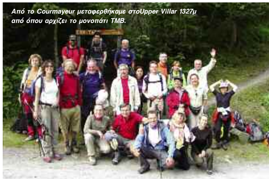
Από το Courmayeur μεταφερθήκαμε στοUpper Villar 1327μ από όπου αρχίζει το μονοπάτι TMB.