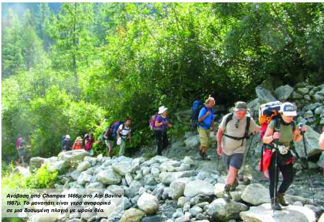
Ανάβαση από Champex 1466μ στο Alpi Bovine 1987μ. Το μονοπάτι είναι γερά ανηφορικό σε μια δασωμένη πλαγιά με ωραία θέα.