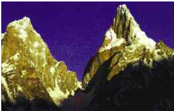
Το μυθικό Ogre και η νότια πλευρά του όπου κινείται η διαδρομή Kennedy-Dempster-Wharton.