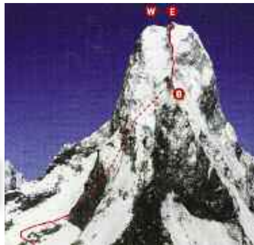
Το Muztagh Tower από τη Νοτιοανατολική πλευρά του. Μια από τις εντυπωσιακότερες κορυφές του Karakoram.