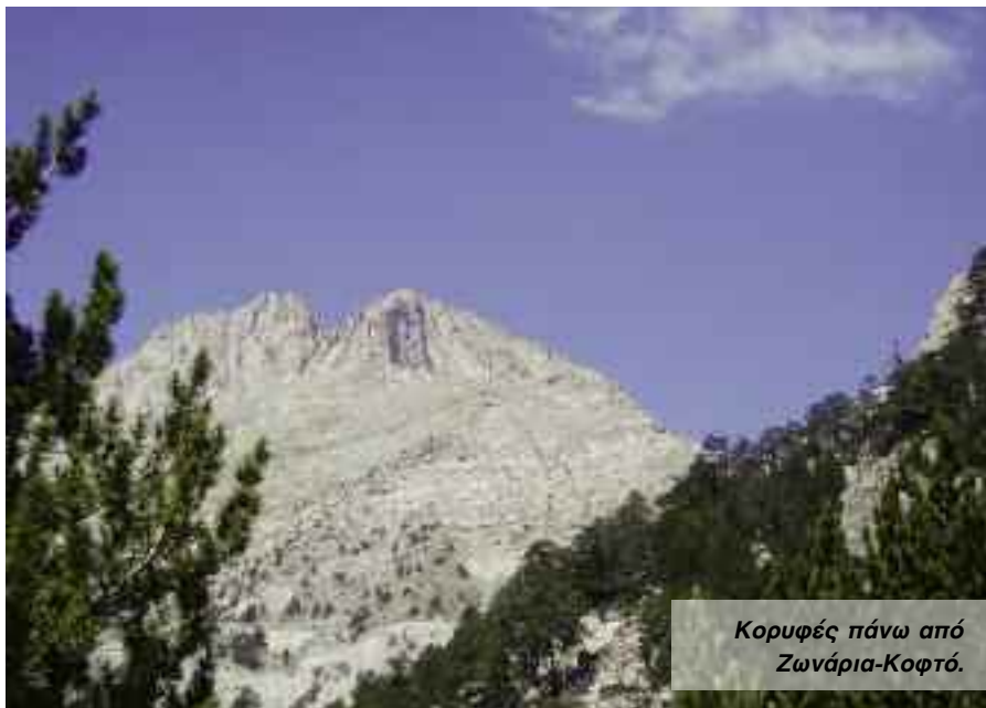
Κορυφές πάνω από Ζωνάρια-Κοφτό.

Η πιο κλασική είσοδος για το Οροπέδιο κάτω από τις κύριες κορυφές. Από το E4 στο τέλος της Χονδρομεσοράχης το μονοπάτι τραβερόρει μια τεράστια πλαγιά γεμάτη σαθρά πετρώματα που τα συγκρατούν βράχια ζωνάρια. Το πρώτο της κομμάτι, με την κορυφογραμμή και την κορυφή της Σκάλας από πάνω, παραμένει σε καλή κατάσταση χάρη και στις συχνές επεμβάσεις-συντηρήσεις. Το δεύτερο κομμάτι των Ζωναριών από το μεγάλο λούκι της Σκάλας μέχρι το Οροπέδιο, κάτω ακριβώς από τα βράχια των κορυφών, είναι ακόμα πιο σαθρό και ευαίσθητο. Η κίνησή μας εδώ απαιτεί προσοχή ενώ παρατηρούμε ελάχιστες επεμβάσεις στο μονοπάτι καθώς η μορφολογία δεν το επιτρέπει. Και σίγουρα δεν βοηθούν οι τρεις (!) Μαραθώνιοι με τους εκατοντάδες αθλητές που περνούν από εδώ, και ειδικά πάνω απο τη λεπτή λωρίδα γης, στην εύθραυστη σάρα κάτω από το Στεφάνι.. Το χειμώνα από το Οροπέδιο προς το Μύτικα προσέχουμε αυτό το κομμάτι, κατεβαίνοντας αν χρειαστεί στη γούρνα του Στεφανιού. Το κυρίως μονοπάτι στα Ζωνάρια