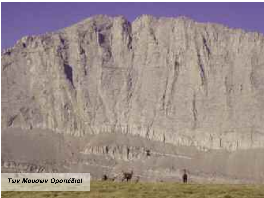
Των Μουσών Οροπέδιο!