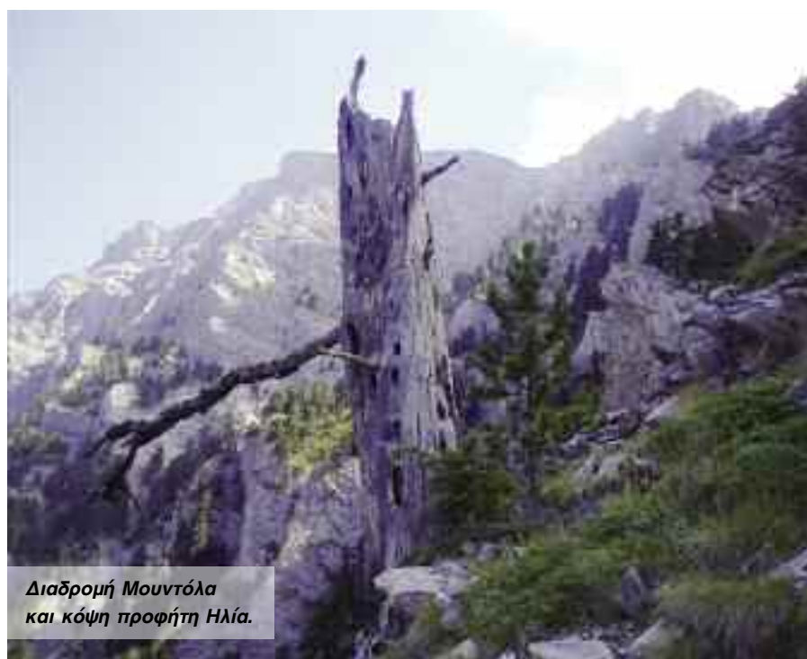
Διαδρομή Μουντόλα και κόψη προφήτη Ηλία.