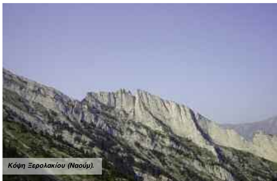
Κόψη Ξερολακίου (Ναούμι).

Αφού βγάλουμε την ανηφόρα του Μπαρμπαλά η όμορφη κορυφογραμμή της ράχης του Παπά θα μας οδηγήσει στην εντυπωσιακή αλπική ζώνη της κόψης. Μπροστά μας η απότομη σαθρή πλαγιά που πάνω της ανηφορίζει με όμορφες στροφές το μονοπάτι. Στα αριστερά μας εντυπωσιακοί πύργοι πετάγονται από την καταπράσινη ρεματιά του Παπά και στα δεξιά μας το ρέμα του Καρασκήνη κατηφορίζει για να συναντήσει τη μεγάλη ρεματιά του Ξερολακίου. Από τη θέση Πετραλέξη, στο δρόμο της ρεματιάς προς τις στηλιές του Ναούμι, μπορεί να γίνει και ανάβαση προς την κόψη. Ανεβαίνουμε με οδηγό τα βράχια που φτάνουν μέχρι την κορυφή Παλιομονάστηρο στη ράχη του Παπά. Η κόψη του Μπαρμπαλά φτάνει μέχρι τα βράχια της Μικρής Τούμπας. Το μονοπάτι όμως την αφήνει, κάνει αριστερά και τραβερσάρεϊ πάνω από τις βόρειες ορθοπλαγιές, προς μια σαθρή ράχη που θα μας βγάλει στο