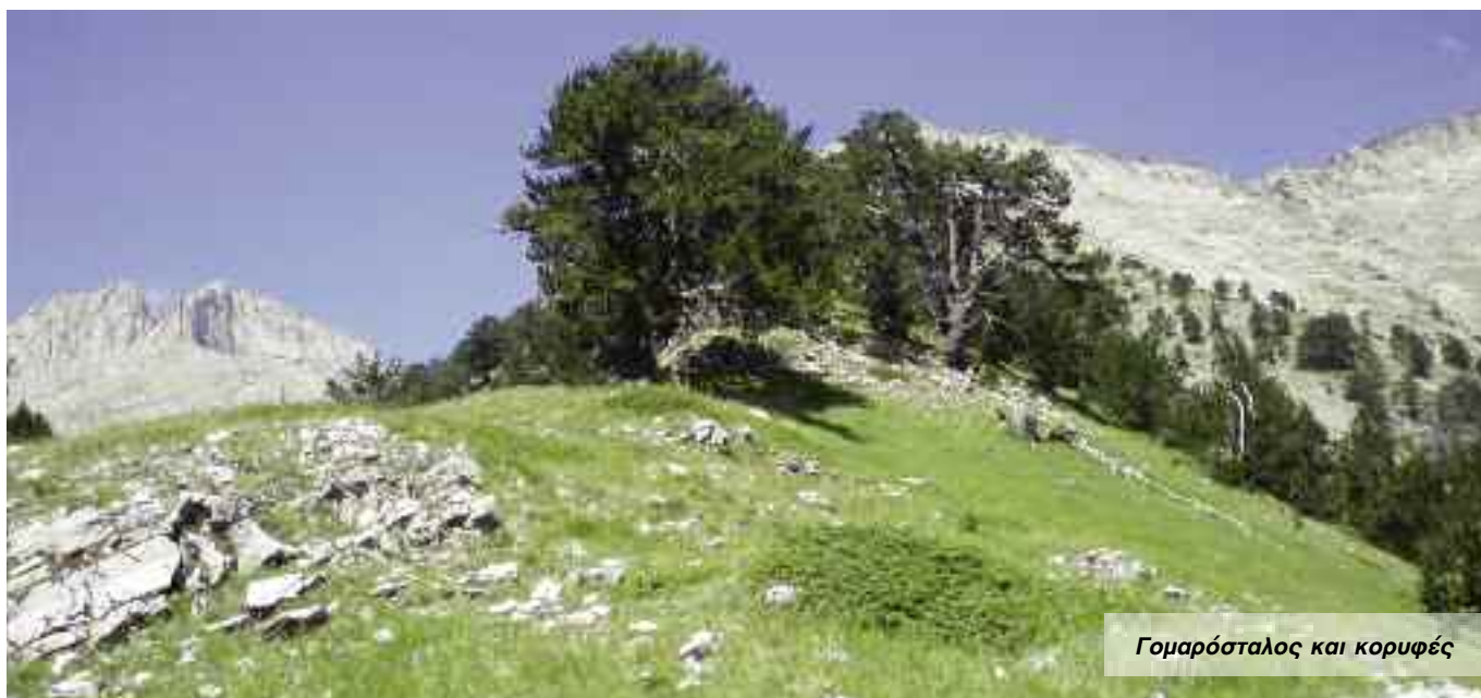
Γομαρόσταλος και κορυφές