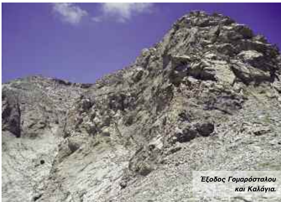
Έξοδος Γομαρόσταλου και Καλάγια.