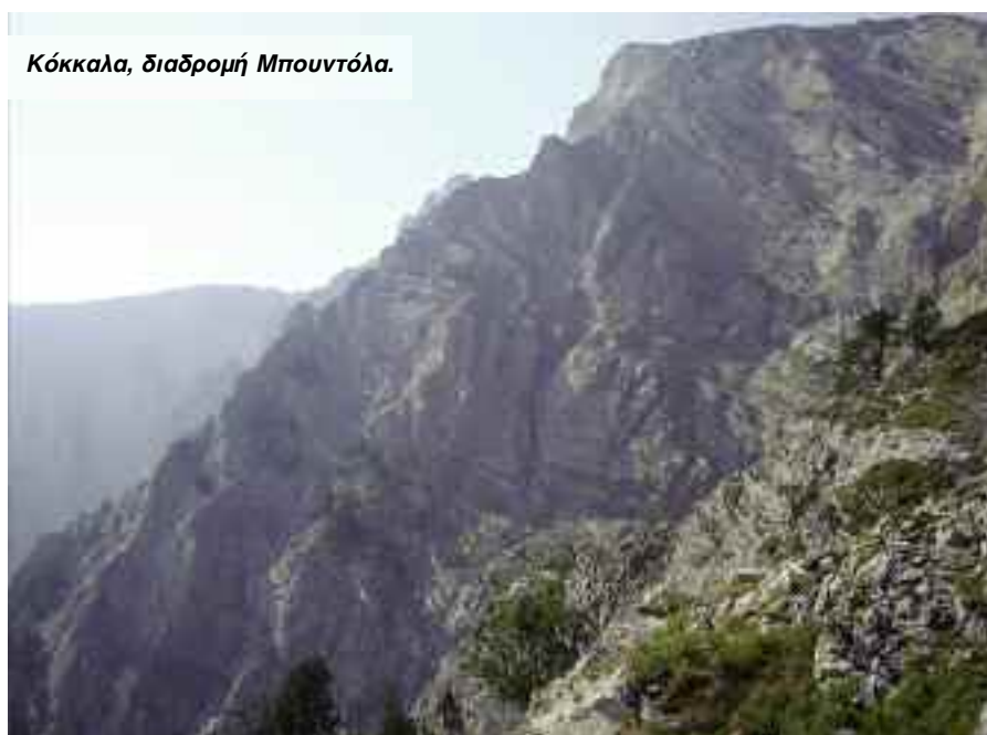
Κόκκαλα, διαδρομή Μπουντόλα.