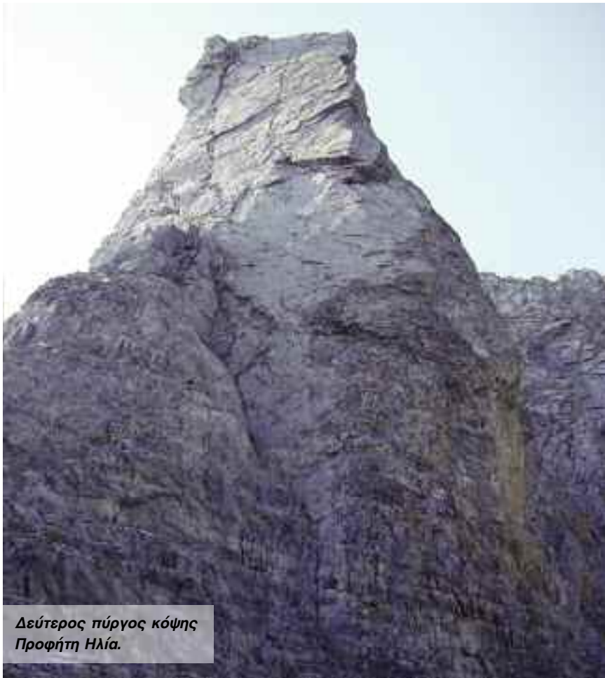
Δεύτερος πύργος κόψης Προφήτη Ηλία.