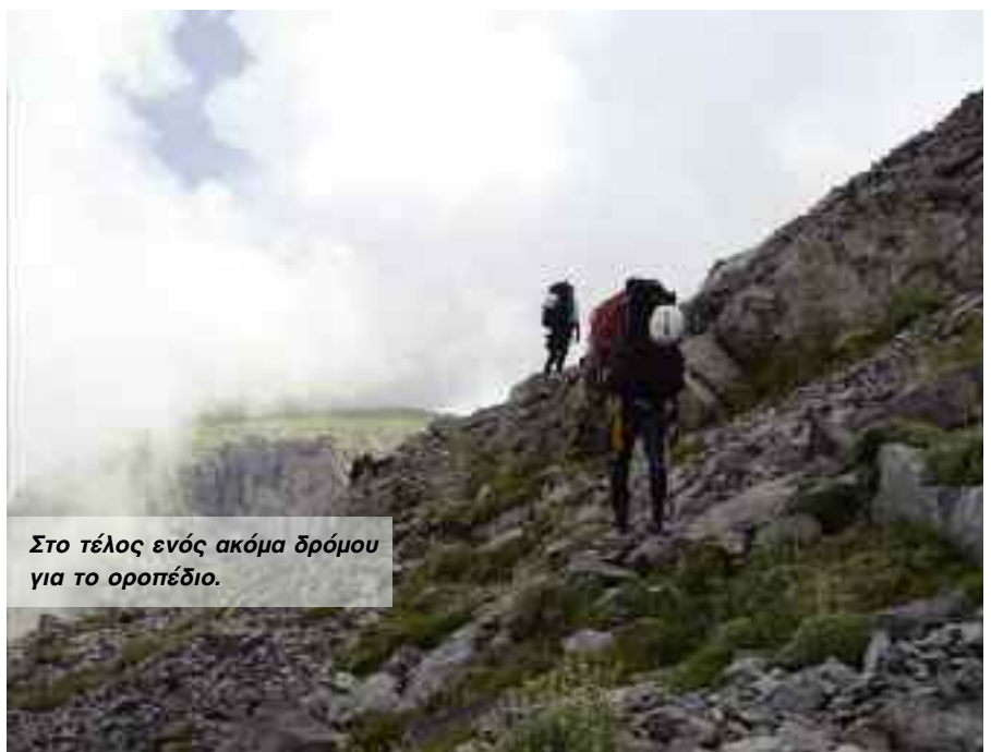
Στο τέλος ενός ακόμα δρόμου για το οροπέδιο.