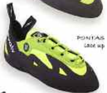
PONIAS Lace up