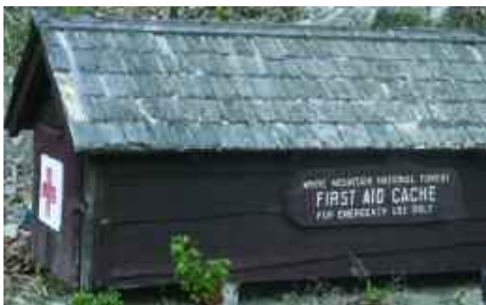
Είδη πρώτων βοηθειών σε άμεση πρόσβαση για τον καθένα.