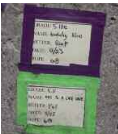
Σε γυμναστήριο στη Βοστώνη. Στη βάση κάθε διαδρομής τα στοιχεία της, δυσκολία, ημερομηνία, όνομα της διαδρομής, όνομα του δημιουργού. Σαν κανονική διαδρομή που ανάλογα με την ομορφιά των κινήσεων παραμένει χωρίς αλλαγές για μεγάλο ή όχι χρονικό διάστημα.