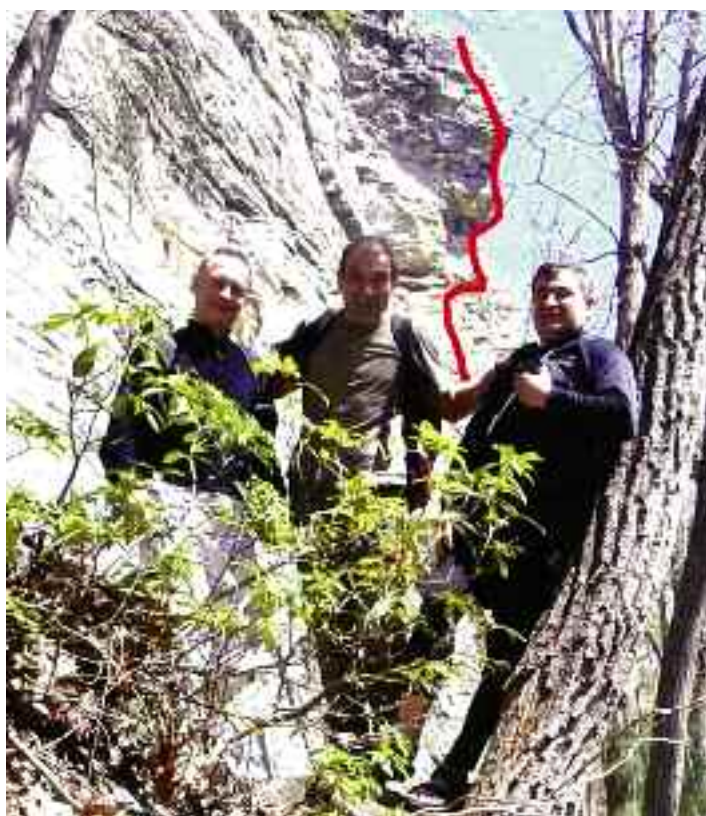
Οι τρεις πενηντάρηδες φίλοι, μπροστά στη διαδρομή μας: "High Exposure", 250 feet, trad, 5.6 που ανοίχτηκε το 1941.