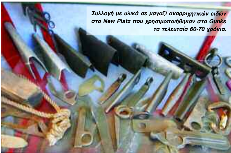
Συλλογή με υλικά σε μαγαζί αναρριχητικών ειδών στο New Platz που χρησιμοποιήθηκαν στα Gunks τα τελευταία 60-70 χρόνια.