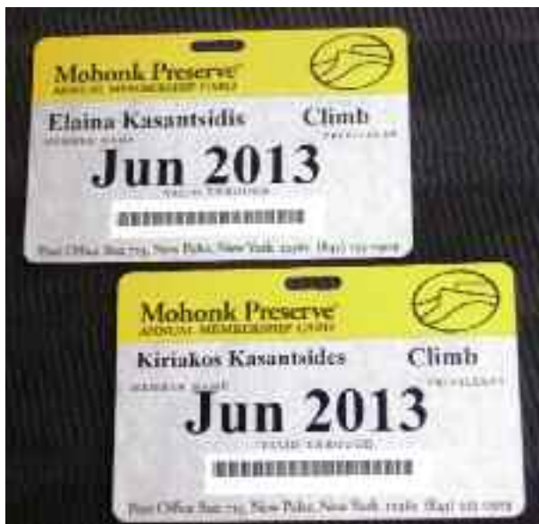
Οι επίσημες κάρτες του Κυριάκου και της γυναίκας του που τους δίνει το δικαίωμα να σκαρφαλώνουν στο πεδίο. Κανονικά, για μία μέρα σκαρφάλωμα πληρώνεις 17 δολάρια, κάτι που περιλαμβάνει και το πάρκινγκ στη διαμορφωμένη αλάνα κοντά στα βράχια (αριστερά).