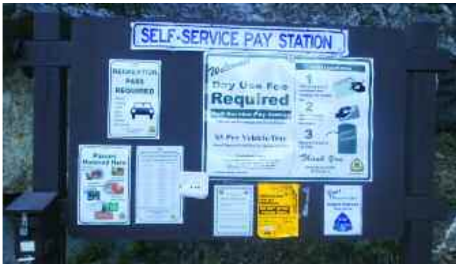
Οι σχετικές πληροφορίες στο πάρκινγκ στο Rumney μαζί με τον τρόπο πληρωμής (3 δολάρια τη μέρα). Εδώ, ακόμη και στους χωματόδρομους κοντά στα πεδία, ελεύθερο πάρκινγκ δεν υπάρχει.