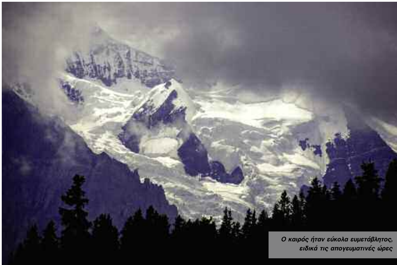
Ο καιρός ήταν εύκολα ευμετάβλητος, ειδικά τις απογευματινές ώρες