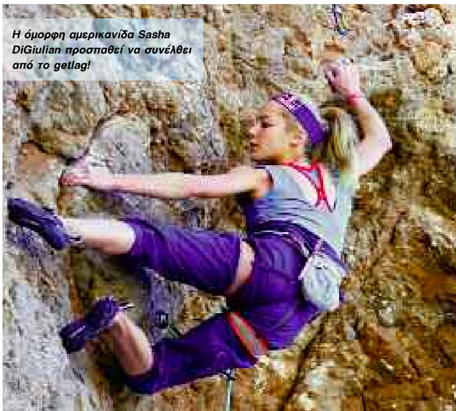
Η όμορφη αμερικανίδα Sasha DiGiulian προσπαθεί να συνέλθει από το gettag!

Ενώ είναι αλήθεια ότι η προσοχή των μέσων ενημέρωσης και το livestreaming επικεντρώθηκε στην δράση PROjectcompetition στο όμορφο νέο πεδίο "ΣκάλιαCave" που βρίσκεται μεταξύ GhostKitchen και Πυλώνα Σκάλια, θα ήταν δίκαιο να πούμε ότι οι 540 συμμετέχοντες των δύο αναρριχτικών μαραθώνιους είχαν σίγουρα μεγάλο μερίδιο στην αναρριχτική διασκέδαση. Ο Herve Barmasse τέλεια περιέγραψε αυτούς τους παθιασμένους αναρριχτές ως εξής: "Το πιο ενδιαφέρον κομμάτι της εκδήλωσης που διοργανώθηκε από τη TheNorthFace. Οι απλοί άνθρωποι, οι οποίοι έχουν έρθει από όλο τον κόσμο να μοιραστούν τη χαρά και το πάθος για την αθλητική αναρρίχηση. Αυτοί, οι καθημερινοί άνθρωποι είναι η καρδιά αυτής της μεγάλης εκδήλωσης... τους αποτίνω τον μεγαλύτερο σεβασμό μου..."