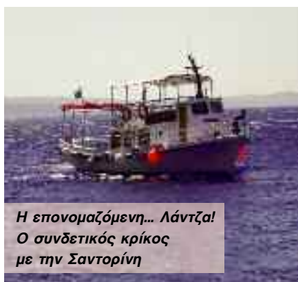
Η επονομαζόμενη... Λάντζα! Ο συνδετικός κρίκος με την Σαντορίνη