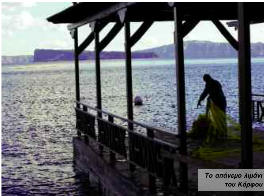
Το απάνεμο λιμάνι του Κόρφου

Πλακόστρωτα, καλντερίμια, αρχέγονες αναβαθμί- δες, αμπέλια σαν καλάθια που προσφέρουν κρασί κα- ταπληκτικής ποιότητας, χωράφια φάβας μα και άφθονα φυτά κάπαρης και αγριοσπάραγγων, πανέμορφα αγριο- λούλουδα, μυρωδιές ρίγανης και φασκόμηλου, φραγκό- συκα, μα και άγρια ομορφιά επιβλητικών βράχων στε- ρεοποιημένου μάγματος, λάβας, ελαφρόπετρας και ηφαιστειακής στάχτης, νησί των αντιθέσεων, της έλ- λειψης μα και του πλούτου συνάμα, της μοναχικότητας μα και της εξωστρέφειας ενίοτε, η Θηρασιά αποτελεί σίγουρα προορισμό μόνο για λίγους και τολμηρούς τα- ξιδευτές που έχουν τα μάτια να δούν, να αφουγκρα- στούν, τη διάθεση να ανακαλύψουν και να κατανοήσουν το θησαυρό που πολύ καλά έχει μάθει να κρύβει μέσα στους αιώνες, το νησί.