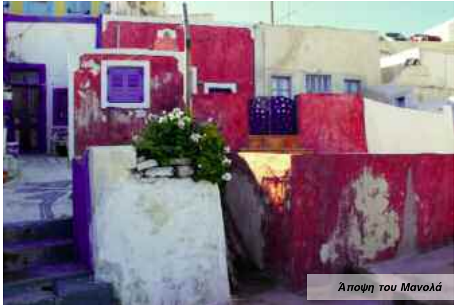
Άποψη του Μανολά

Όταν πληροφορήθηκα τηλεφωνικώς ότι είχα προσληφθεί ως ωρομίσθιος καθηγητής στο Γυμνάσιο - Λύκειο Θηρασιάς, το πρώτο πράγμα που έκανα ήταν να κοιτάξω έναν χάρτη, καθότι δεν είχα ιδέα πού βρίσκεται αυτό το μικρό νησάκι. Η έκπληξή μου ήταν ακόμα μεγαλύτερη όταν είδα το μέγεθος που καταλαμβάνει αυτή η κουκίδα πάνω στο απέραντο γαλάζιο του Αιγαίου - είναι δυνατόν να υπάρχει σχολείο εκεί; απόρησα. Και όμως! Ως επιστέγασμα της διάψευσης των αποριών μου και κόντρα στη νοοτροπία που θέλει έρρημα χωριά (και νησάκια ενίοτε) και ασφυκτικά γεμάτες πόλεις, η Θηρασιά μετρά καμιά διακοσοριά μόνιμους κάτοικους το χειμώνα, που παντρεύονται, γεννοβολούν, εργάζονται και μένουν στο νησί τους για όλη τους τη ζωή! Και αν αναλογιστεί κανείς ότι το σχολείο έχει μαθητές σε όλες τις βαθμίδες (από νηπιαγωγείο μέχρι λύκειο) και η νέα γενιά δεν δείχνει διάθεση να φύγει για τον Πειραιά (προσφιλής προορισμός) τότε οι ρίζες της ανθρώπινης παρουσίας καλά κρατούν πάνω του. (Προς το παρόν...)