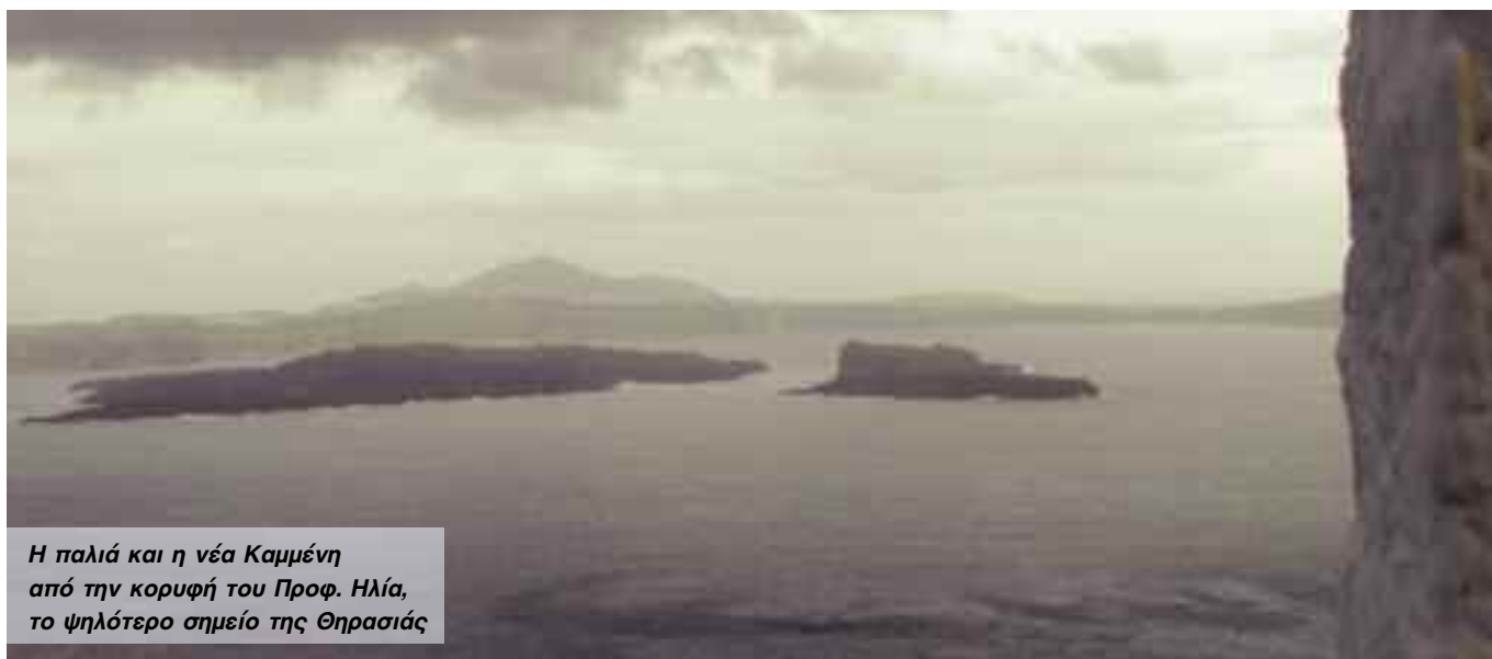
Η παλιά και η νέα Καμμένη από την κορυφή του Προφ. Ηλία, το ψηλότερο σημείο της Θηρασιάς