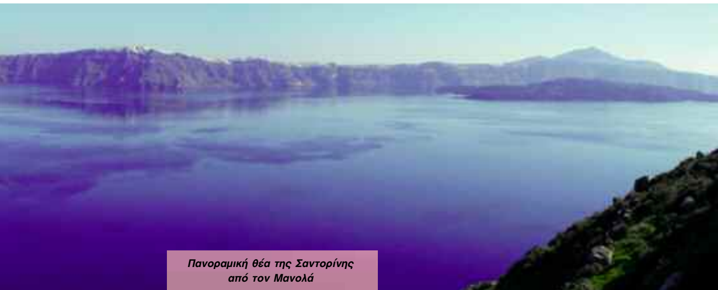
Πανοραμική θέα της Σαντορίνης από τον Μανωλά