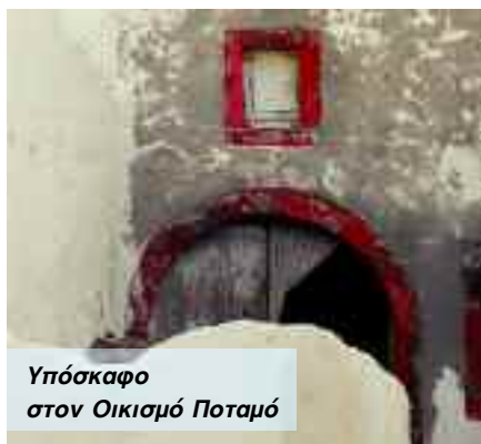
Υπόσκαφο στον Οικισμό Ποταμό