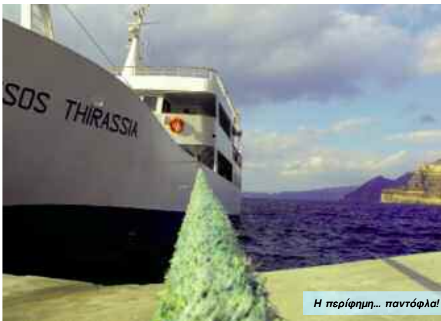
Η περίφημη... παντόφλα!