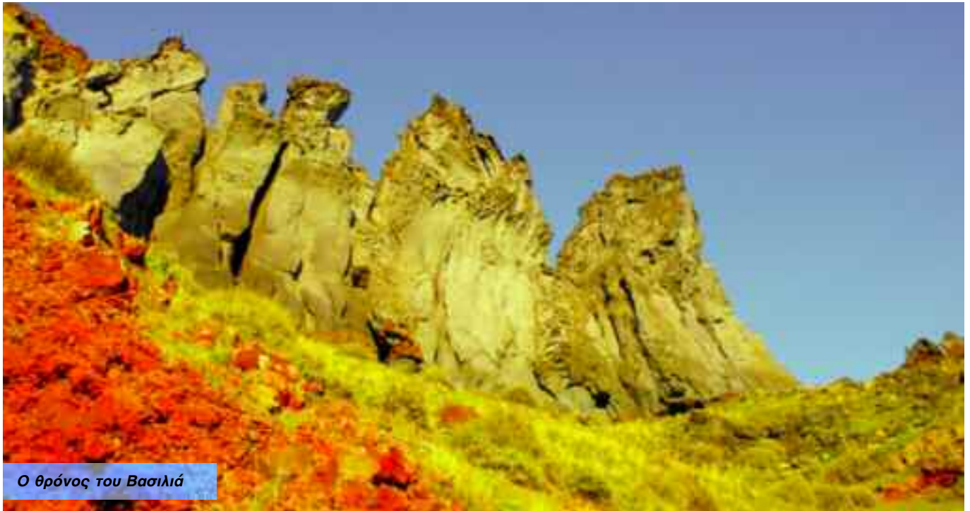
Ο θρόνος του Βασιλιά