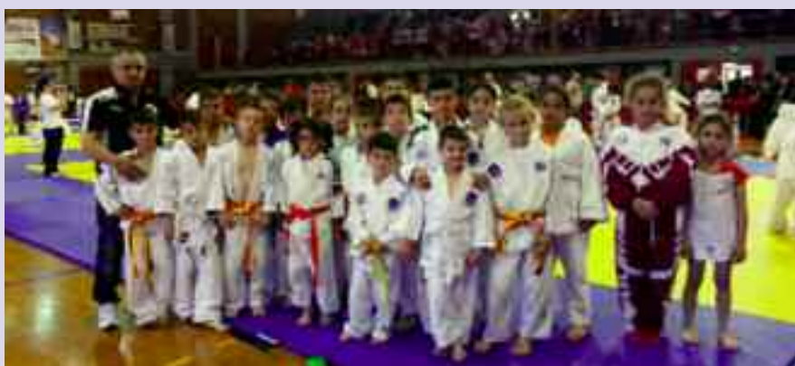
2ο Διεθνές Τουρνουά «Ilioupolis Cup» 24-25 Μαΐου