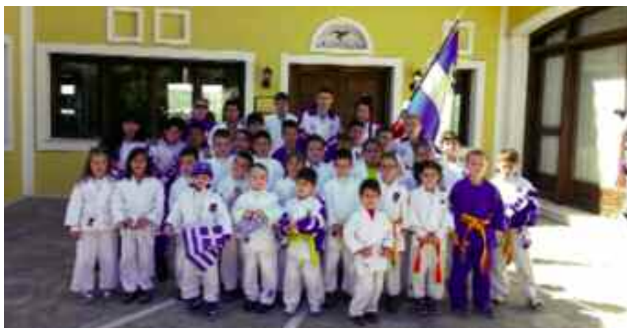
Το τμήμα τζούντο του ΕΟΣ Αχαρνών πριν την παρέλαση στις 25 Μαρτίου έξω από τα γραφεία του συλλόγου (επάνω). Κάτω η ομάδα στην παρέλαση.