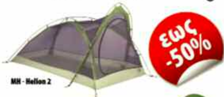
MH - Helion 2