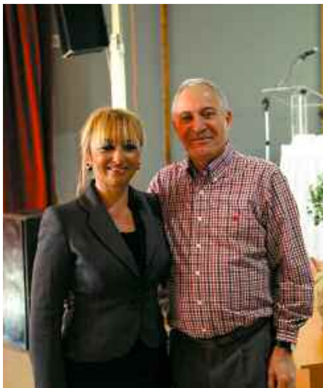
Ο Πρόεδρος της ΕΟΟΑ κ. Δ. Γεωργούλης και η Αντιπεριφερειάρχης Πιερίας κα. Σ. Μαυρίδου.

Συγχαρητήρια αξίζουν στην Αντιπεριφερειάρχη κα Σοφία Μαυρίδου στη συνεργατιά της κα Ράνια Μπίρτση και σε όσους συνεργάστηκαν για την άψογη διοργάνωση της ημερίδας.