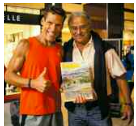
Ο Dean Karnazes με τον υπεύθυνο διαφημίσεων του περιοδικού "ΚΟΡΦΕΣ" κ. Παύλο Παύλου.

νος αθλητής αντοχής και συγγραφέας best seller, έχει ωθήσει το σώμα του και το μυαλό σε ασύλληπτα όρια. Ανάμεσα στα πολλά επιτεύγματά του, έχει τρέξει για 350 συνεχή μίλια, χωρίς ύπνο για 3 ολόκληρες νύχτες. Επίσης, έχει τρέξει σε ακραίες καιρικές συνθήκες, σε υψηλές θερμοκρασίες ζέστης και κρύου. Στην πιο πρόσφατη προσπάθειά του συμμετείχε σε 50 μαραθώνιους, που πραγματοποιήθηκαν σε 50 διαφορετικές πολιτείες των ΗΠΑ, για 50 συνεχόμενες ημέρες. Οι περιπέτειες του Dean έχουν προβληθεί στις εκπομπές: 60 Minutes, The Late Show με τον David Letterman, CBS News, CNN, ESPN, The Howard Stern Show, NPR's Morning Edition, the BBC, και πολλές ακόμη. Έχει εμφανιστεί στο εξώφυλλο του Runner's World και του Outside και έχει προβληθεί, μεταξύ άλλων, στα εξής μέσα: TIME, Newsweek, People, GQ, The New York Times, USA TODAY, The Washington Post, Men's Journal, Forbes, The Chicago Tribune, The Los Angeles Times και London Telegraph. Διαθέτει μηνιαία στήλη στο περιοδικό Men's Health, το περιοδικό με τη μεγαλύτερη κυκλοφορία στον κόσμο.