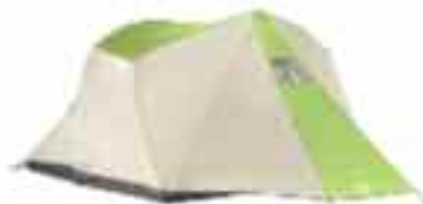
MH - Casa 2