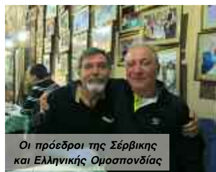
Οι πρόεδροι της Σέρβικης και Ελληνικής Ομοσπονδίας

τους μετέχοντες στην ιστορική πόλη του Mostar και τα αξιοθέατα της περιοχής.