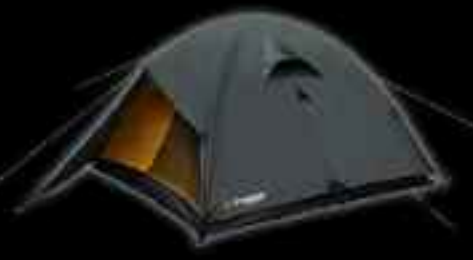
OUTDOOR Ohio Τιμή: 120€