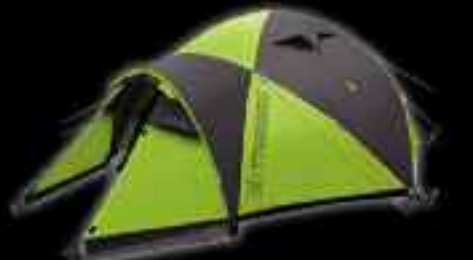
ADVENTURE Base Camp - D Τιμή: 310€