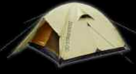
TREKKING Frontier Τιμή: 145€