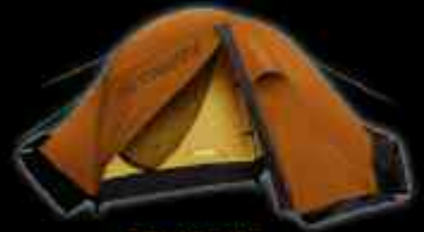
EXTREME Escapade DSL Τιμή: 350€