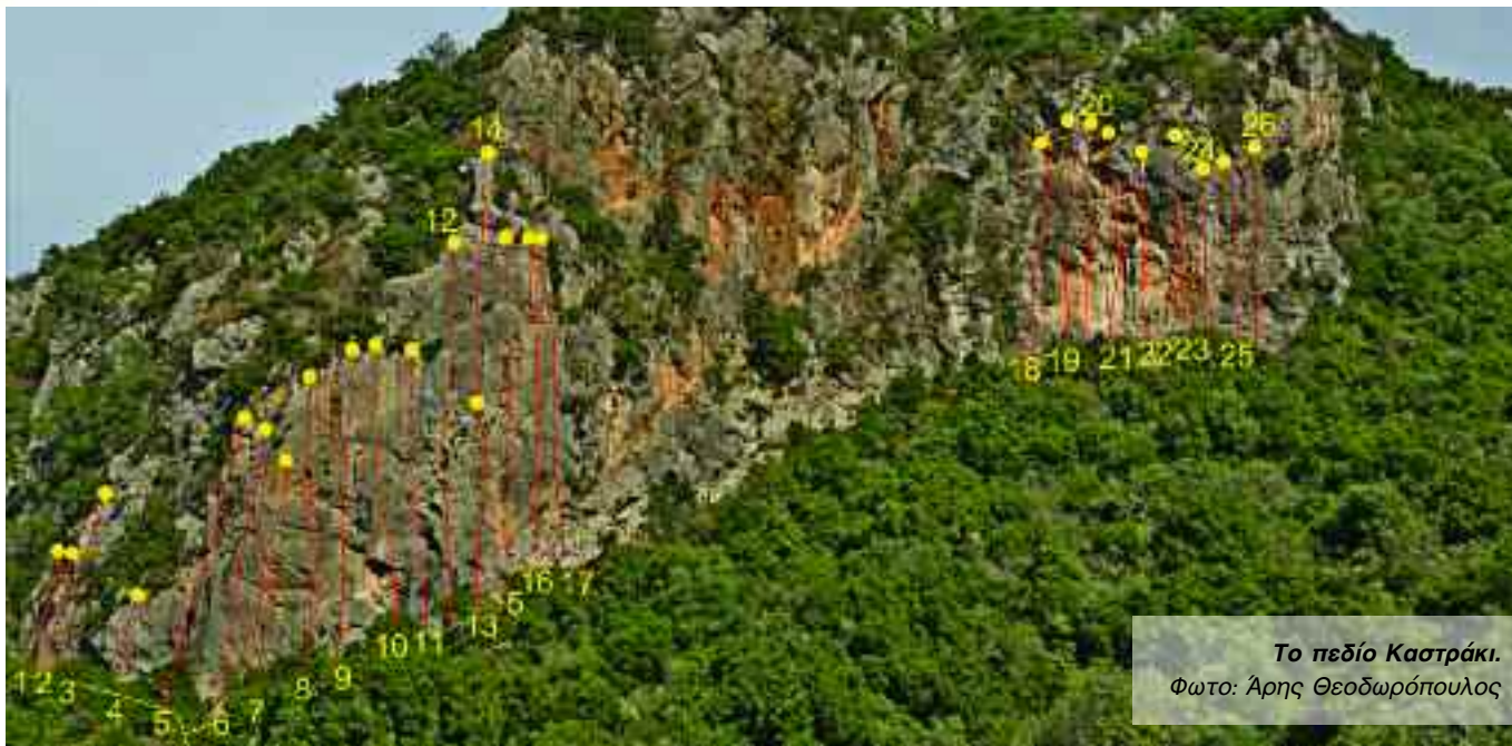
Το πεδίο Καστράκι.