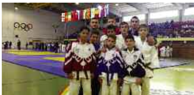
Διεθνές Τουρνουά Τζούντο Αμύνταιου