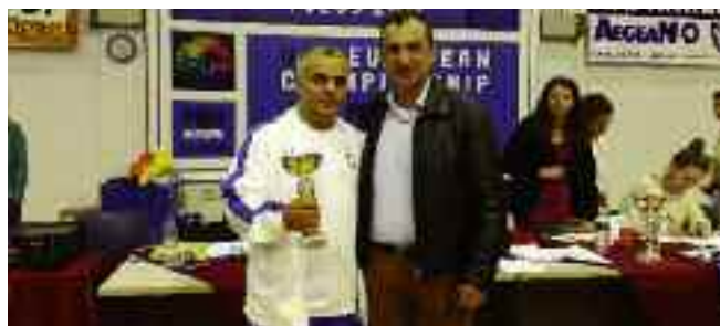
3ο Τουρνουά Τζούντο "Panionios Cup"