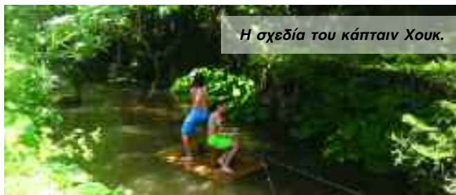
Η σχεδία του κάπταιν Χουκ.