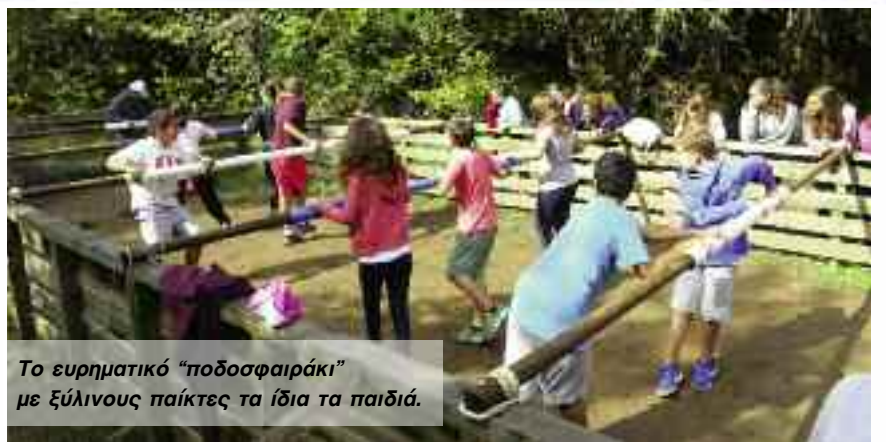
Το ευρηματικό "ποδοσφαιράκι" με ξύλινους παίκτες τα ίδια τα παιδιά.

Δεν είμαστε σε μια ρεματιά στην όμορφη Οίτη πάνω από το χωριό Παύλιανη, ούτε εγώ είμαι δάσκαλος με τους μαθητές του. Είμαι ο Πήτερ Παν και βρίσκομαι στη χώρα του ποτέ με τους τρελούτσικους φίλους μου. Και αναρωτιέμαι, ποιοι, πως και πότε έφτιαξαν αυτό το μικρό παιδικό παράδεισο, αυτό το τόσο ευρηματικό παρκάκι μέσα στη φύση!