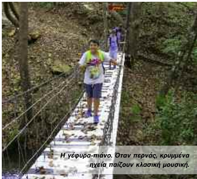
Η γέφυρα-πιάνο. Όταν περνάς, κρυμμένα ηχεία παίζουν κλασική μουσική.