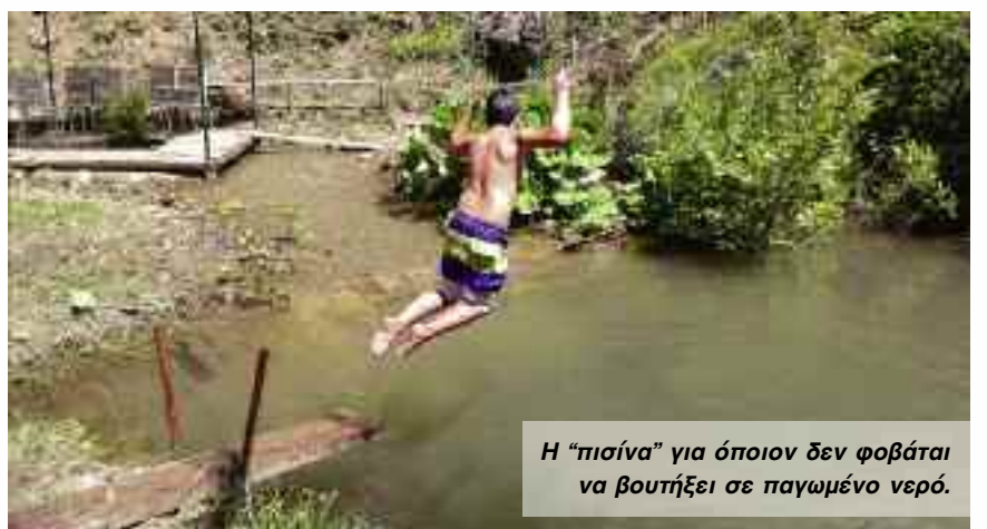
Η "πίσινα" για όποιον δεν φοβάται να βουτήξει σε παγωμένο νερό.